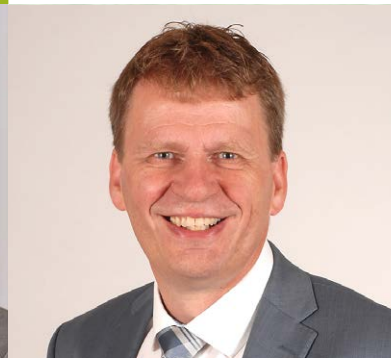
JAN VENTE GEMEENTE LOPIK