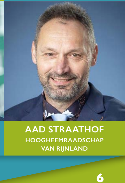
AAD STRAATHOF HOOGHEEMRAADSCHAP VAN RIJNLAND