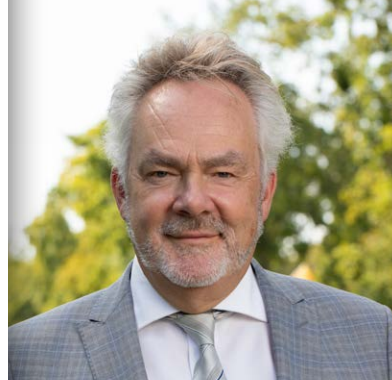
AD DE REGT GEMEENTE WOERDEN